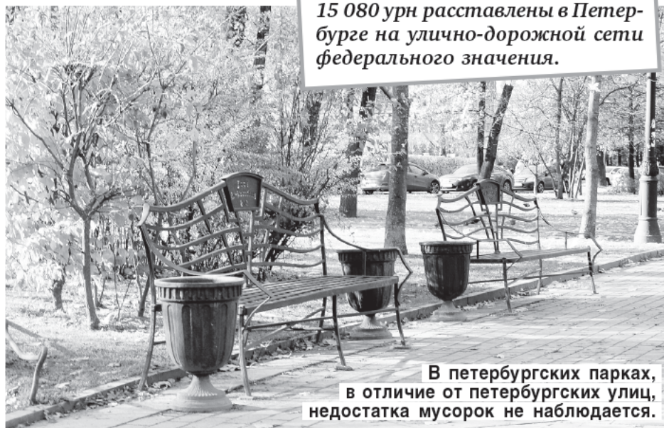
15 080 урн расставлены в Петербурге на улично-дорожной сети федерального значения.