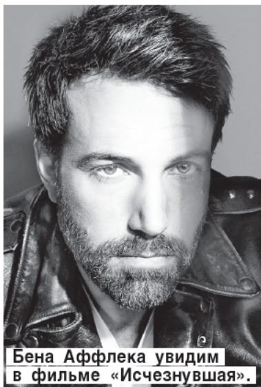
Бена Аффлека увидим в фильме «Исчезнувшая».

На наших экранах идет фильм Дэвида Финчера «Исчезнувшая» по роману Гиллиан Флинн — о муже, разыскивающем пропавшую в день пятилетия свадьбы жену. Мужа сыграл Бен Аффлек. И ответил на несколько вопросов.