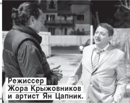
Режиссер Жора Крыжовников и артист Ян Цапник.