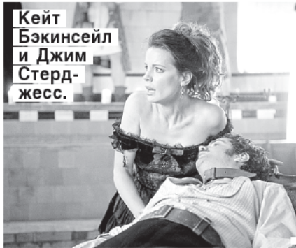
Кейт Бэкинсейл и Джим Стерджесс.

Режиссер — Брэд Андерсон. В ролях: Кейт Бэкинсейл, Бен Кингсли, Джим Стерджесс, Майкл Кейн, Брендан Глисон, Дэвид Тьюлис, Джейсон Флеминг, Шинейд Кьюсак, Эдмунд Кингсли. США, 2014.