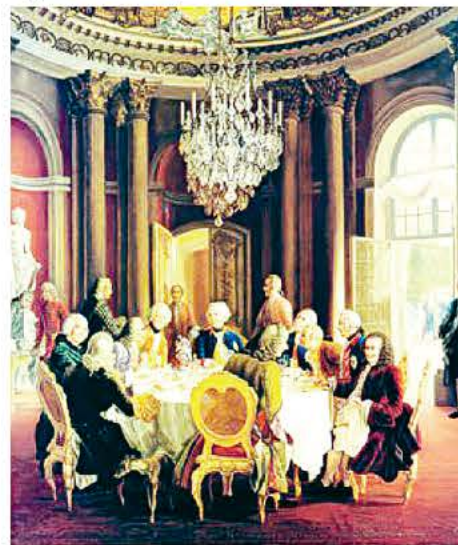
«Сей стол обеденный искусно уберут...». Банкет Фридриха II в потсдамском дворце Сан-Суси. Художник Адольф фон Менцель. 1850 год.

кедаря Карла VI, полки лихого берлинского Мальбрука вторглись в принадлежавший Габсбургам район Силезии. В считанные недели эта изобильная, богатая зона поменяла обладателя. Вскоре пруссаки задали австрийцам хорошую трепку в местечке Мольвиц. А летом 1741 года французские батальоны маршала Шарля де Бель-Иля, «подверстав» баварцев и саксонцев, ворвались в Верхнюю Австрию и чешские области. Зиме была занята красавица Прага. На континенте вспыхнула пресловутая война за Австрийское наследство. И аппетит приходил во время еды. Вдохновленный Людовик XV решил, что сочтется славой с другом-приятелем Фридрихом II. Он извлек из кармана свою немецкую марионетку — баварского курфюрста Карла Альбрехта — и провозгласил его королем Чехии, а чуть погодя — кайзером «Священной Римской империи германской нации».