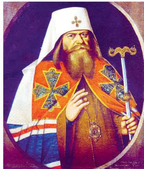
«Поддай мне, Боже, Твой покров...». Десятый патриарх Русской православной церкви — святейший Адриан (около 1627-го — 1700).

жал не только безумный милитаристский зуд Фридриха — отталкивал и его личный быт. Шелестели упорные слухи о нетрадиционных половых влечениях августейшего крестоносца. И «натуралку» Елизавету, любившую крепких, статных, здоровых мужчин, трясло от одной мысли, что на западных рубежах России будет хозяйничать коронованный греховодник.