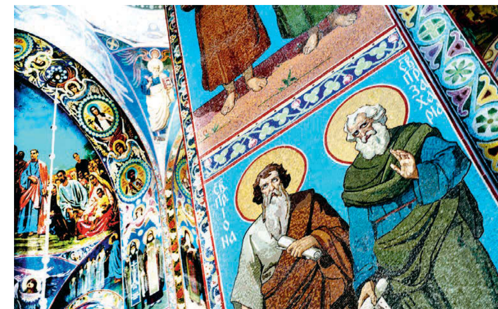
Живопись и мозаика собора постоянно реставрируются.

Вы видите, что баннером закрыта сень — место смертельного ранения императора. Выше колонн — гипсовая модель, распечатанная под камень. Пришла в такое состояние, что ее надо чистить. Надеемся завершить до 15 декабря. Параллельно идут работы по воссозданию элементов этого шатра. Мы надеемся постепенно начать воссоздание самого шатра. В план следующего года включили работы по реставрации фасада.