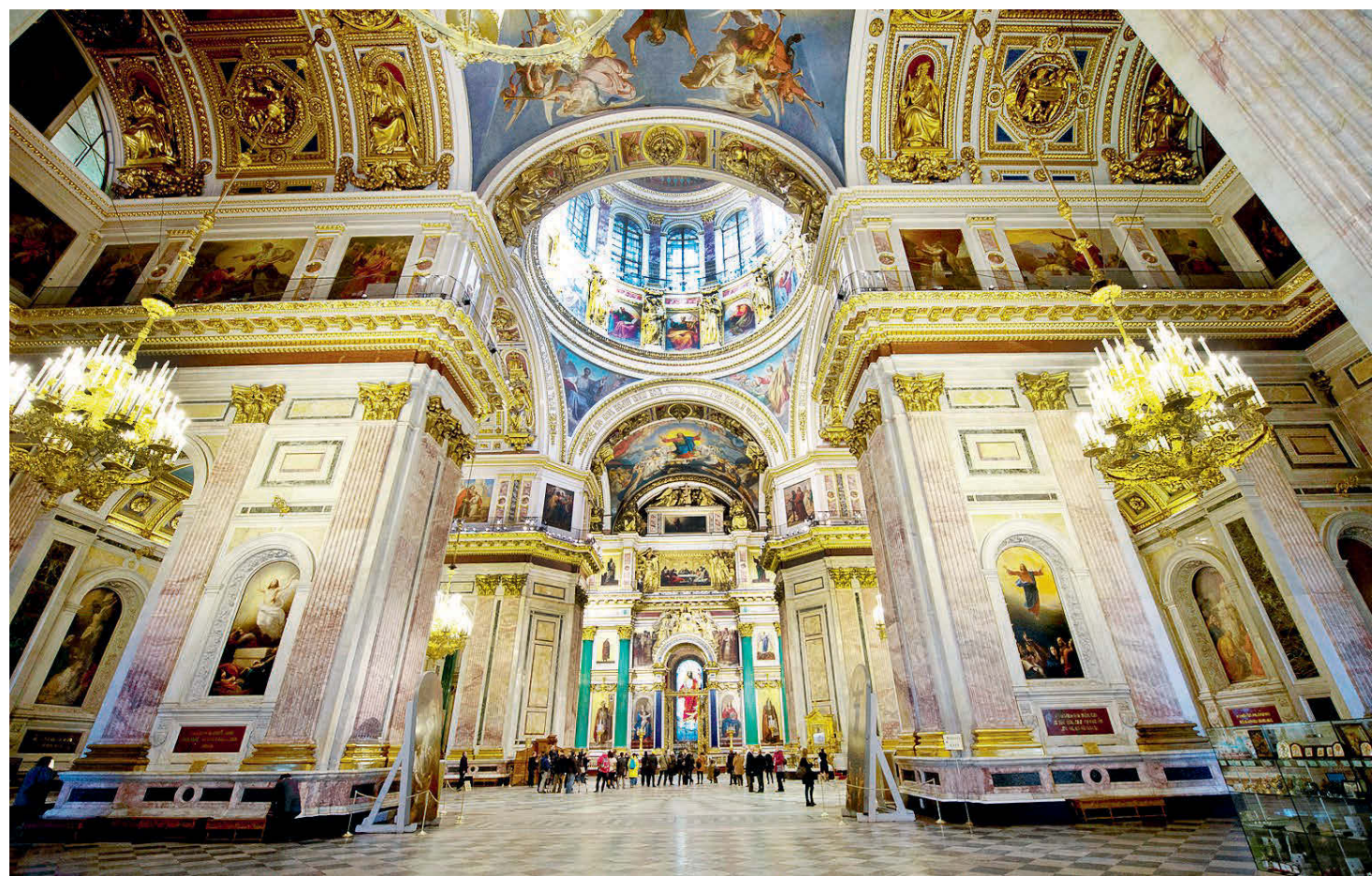
В Исаакиевском соборе тоже будет энергосберегающее освещение.

но был очень сильный ледяной ветер. Неженки спрятались в каюту, а ваши корреспонденты, закутавшись в шерстяные пледы, мужественно мерзли на палубе, зато вволю налюбовались красотами осеннего Петербурга с воды и запечатлели эти великолепные панорамы для вас.