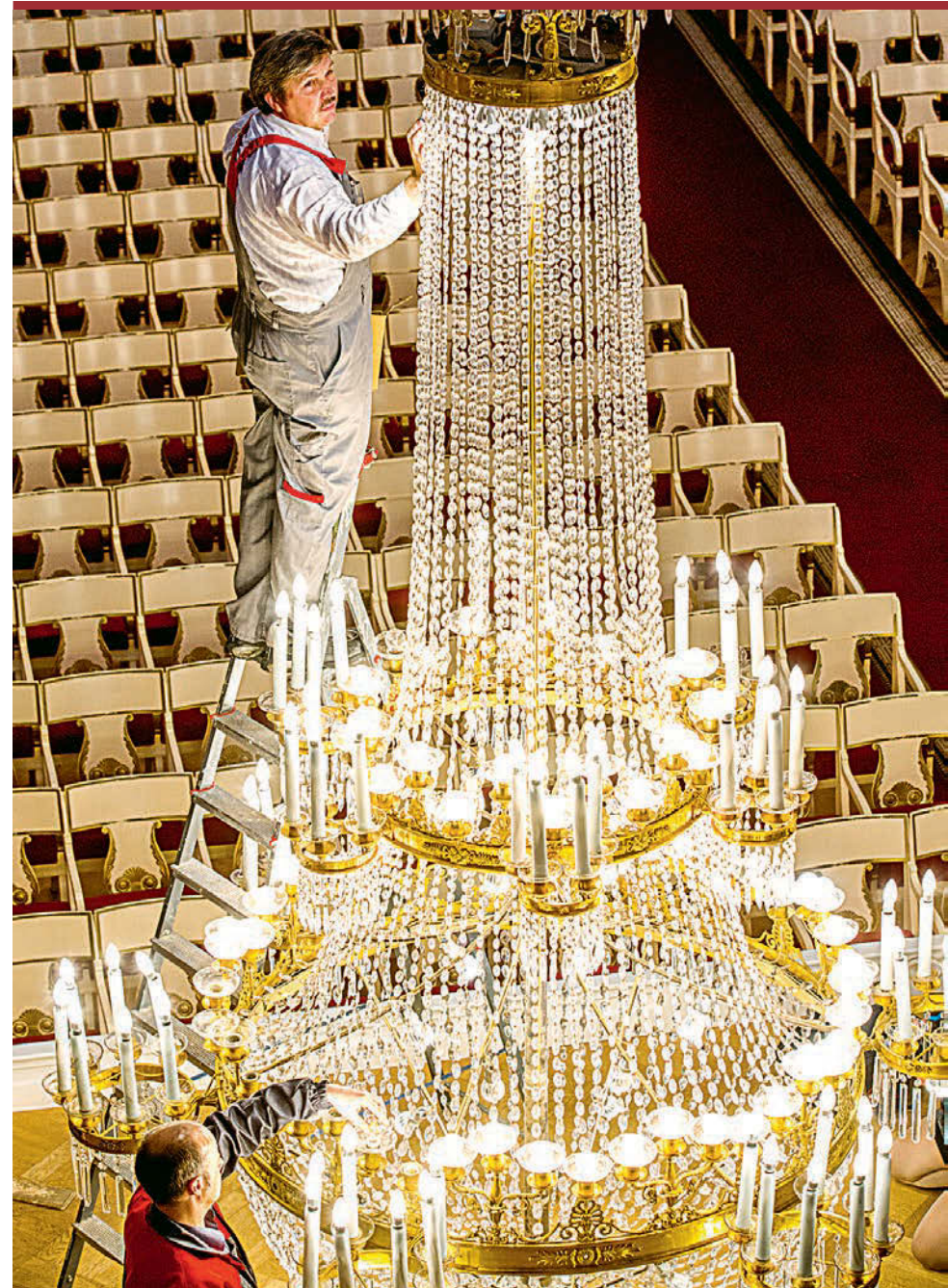
Лампочки для этих люстр придумывали специально.