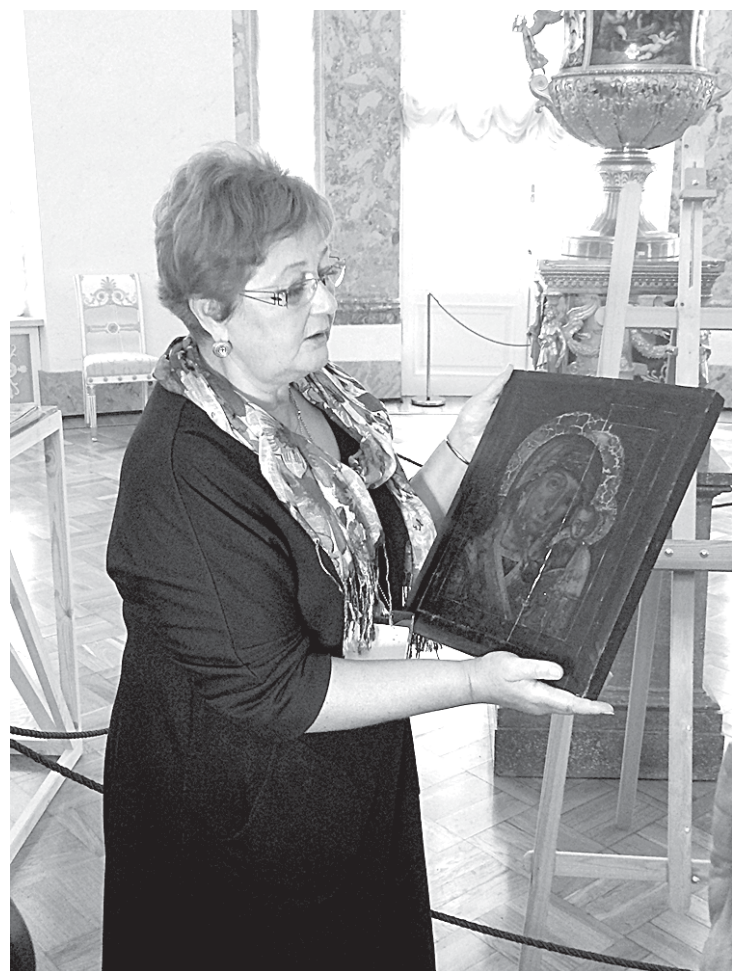
Икона Богоматери (на ней — инвентарный номер Екатерининского дворца) принадлежала графине Гендриковой.

Сergeй ПРУДНИКОВ