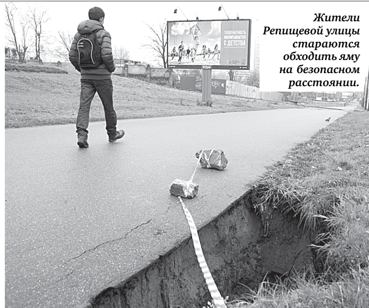
Жители Репищевой улицы стараются обходить яму на безопасном расстоянии.