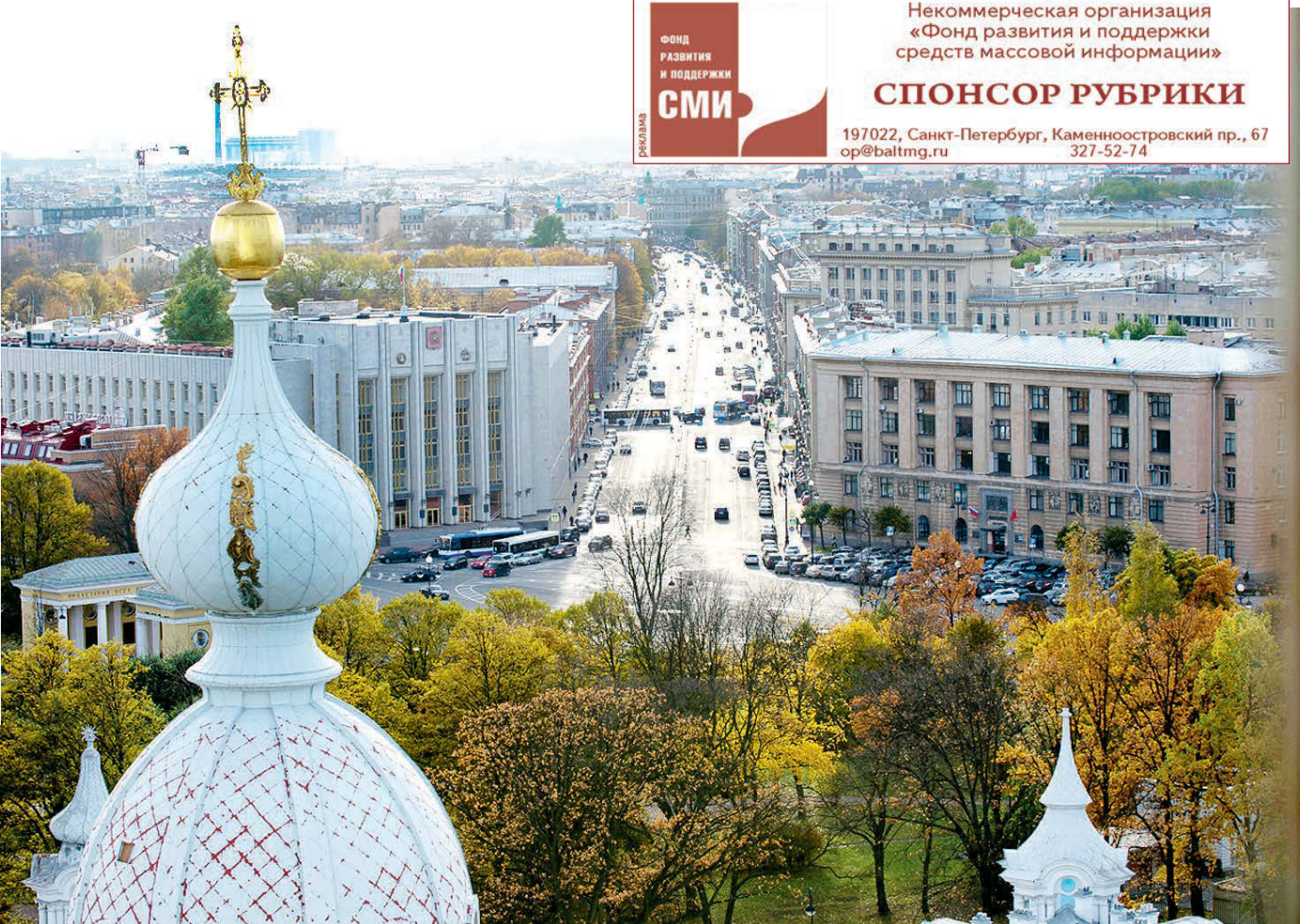
Вид на город с крыши собора.

стью, с губернатором Георгием Полтавченко, который знает об этой проблеме, понимает ее. Пока мы надеемся на этот проект. Хотя нам много раз говорили о помещении ДК «Большевичка» на улице Тюшина. Там здание, которое требует колоссальных ремонтных работ. За год мы сделали полностью обследование этого здания. Оно находится в ужасном состоянии. Требуется огромные средства, не заложенные в бюджет. Так что для нас предпочтительнее Невский проспект.