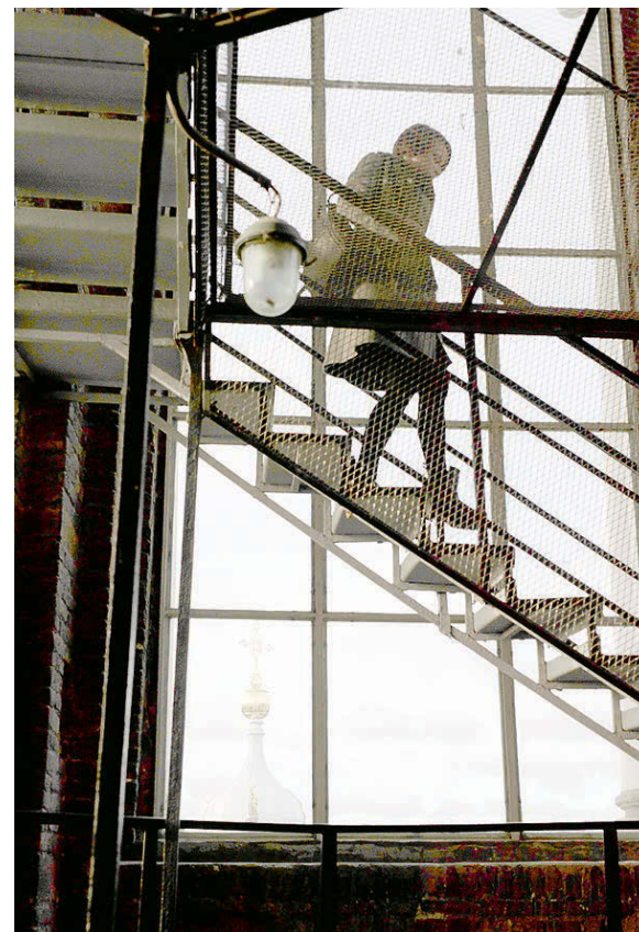
На колокольню Смольного собора ведут 277 ступеней.