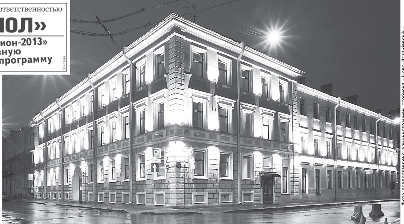
В вечернем свете здание особенно выигрывает.

«ВЕЧЕРНИЙ ПЕТЕРБУРГ» ИЩЕТ И НАХОДИТ ПРИМЕРЫ УДАЧНОГО СОХРАНЕНИЯ СТАРЫХ ЗДАНИЙ ИСТОРИЧЕСКОГО ЦЕНТРА