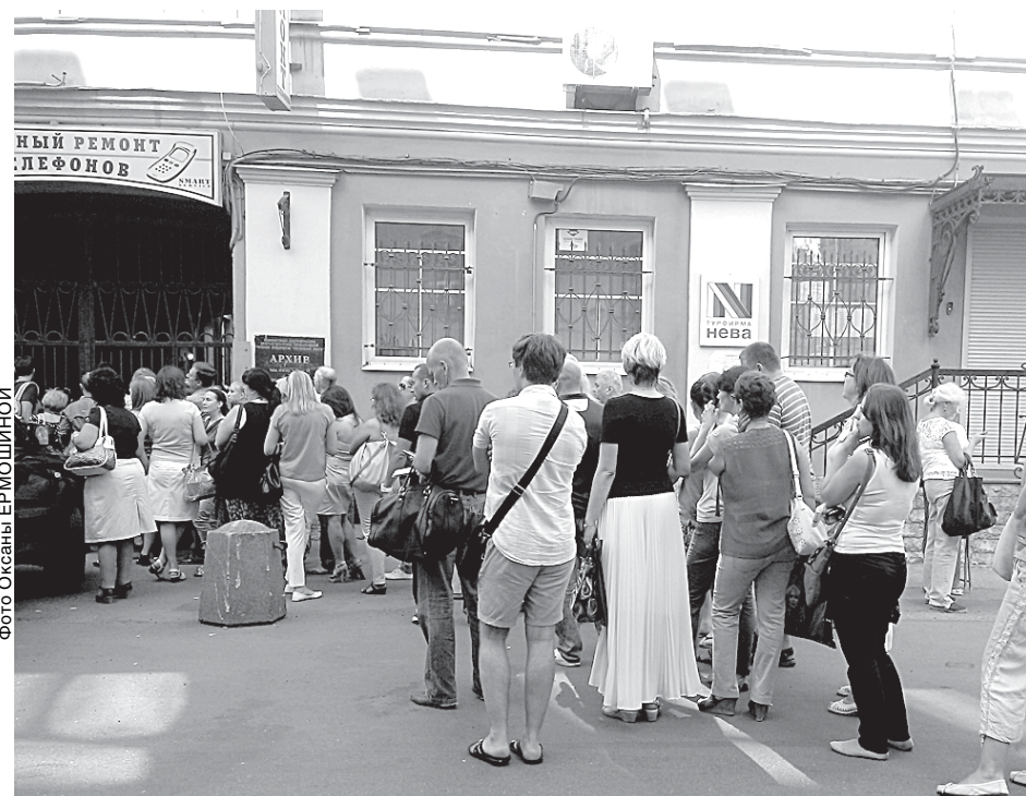
Обанкротившаяся первой турфирма «Нева» застраховалась в небольшой московской компании, у которой сейчас отозвали лицензию, и никто от нее ничего не может уже получить.

Беседовала Светлана ЯКОВЛЕВА