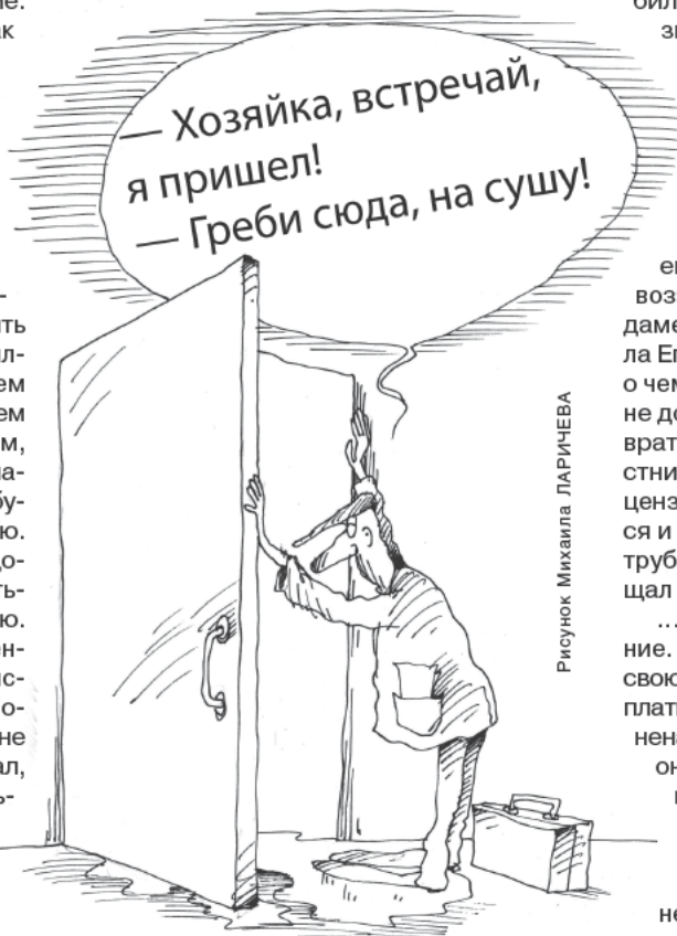
Рисунок Михаила ЛАРИЧЕВА