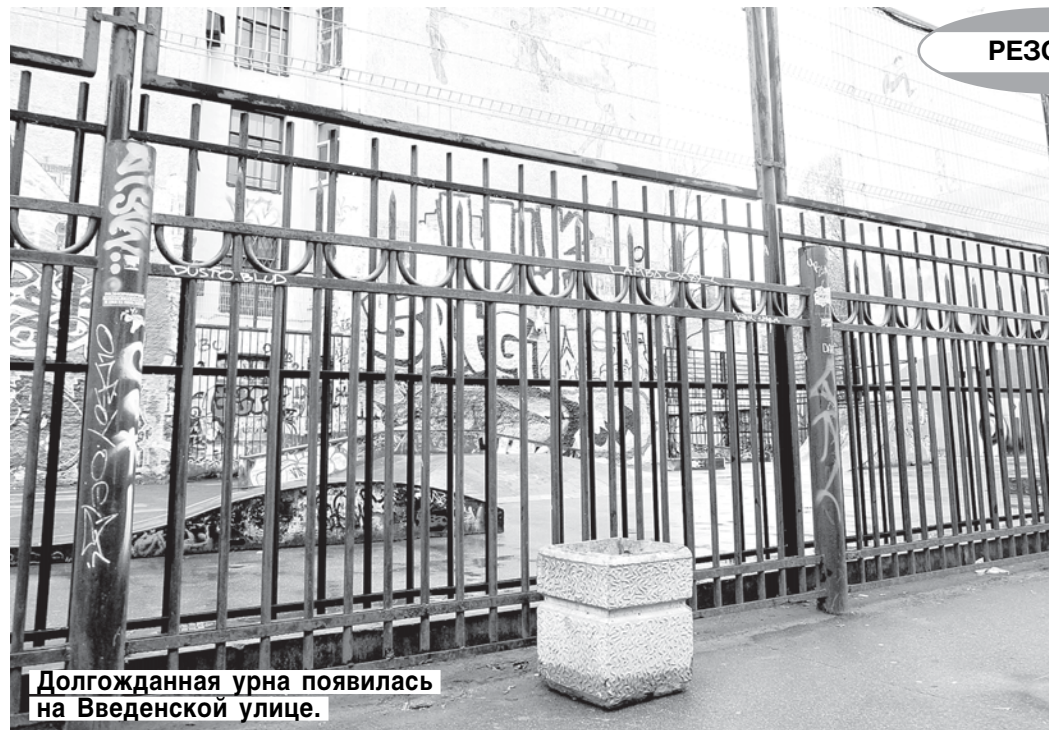
Долгожданная урна появилась на Введенской улице.