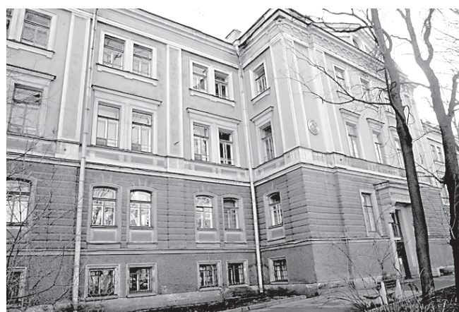
Родильный дом имени профессора Снегирева — «Снегиревка».

● В исторических зданиях находятся многие петербургские больницы, основанные больше ста лет назад, и часть из них тоже сейчас стоит в лесах из-за ремонта фасадов.