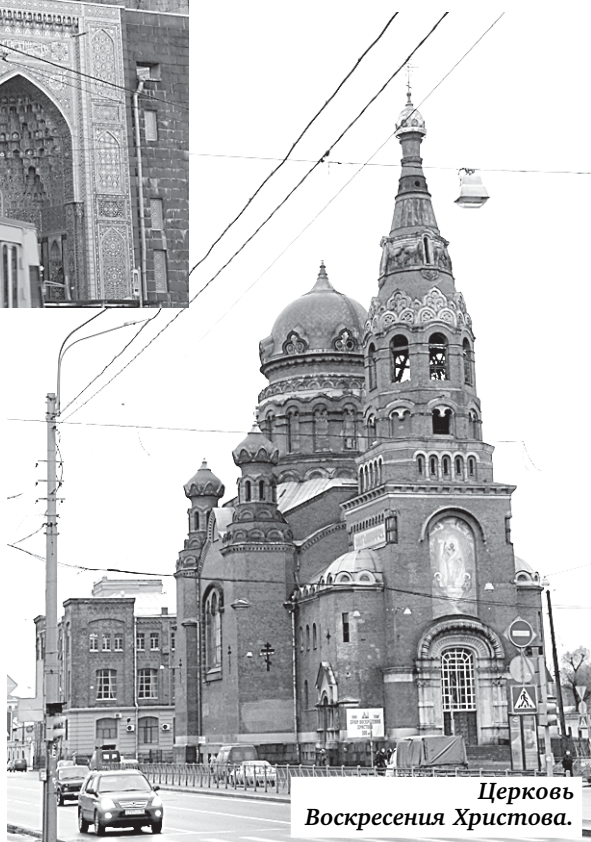
Церковь Воскресения Христова.

● Еще один красивейший петербургский храм, построенный на народные деньги, — Церковь Воскресения Христова на Обводном канале, 116. Она возведена в начале XIX века по проекту академика архитектуры Гримма «на пятаки трезвенников», то есть на добровольные пожертвования многочисленных петербургских рабочих, состоявших в Александро-Невском обществе трезвости. Сейчас идет реставрационный ремонт фасадов храма со стороны центрального входа. Он закончится в 2016 году.