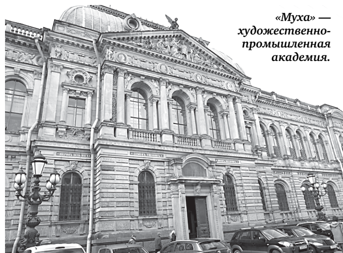
«Муха» — художественно-промышленная академия.

● Реставрационный ремонт лицевого фасада Петербургской государственной художественно-промышленной академии в Соляном переулке тоже будет закончен уже в этом году. Здание было возведено в 1879 — 1881 годах по проекту архитекторов Кракау и Гедике специально для училища технического рисования на средства, пожертвованные бароном Штиглицем.