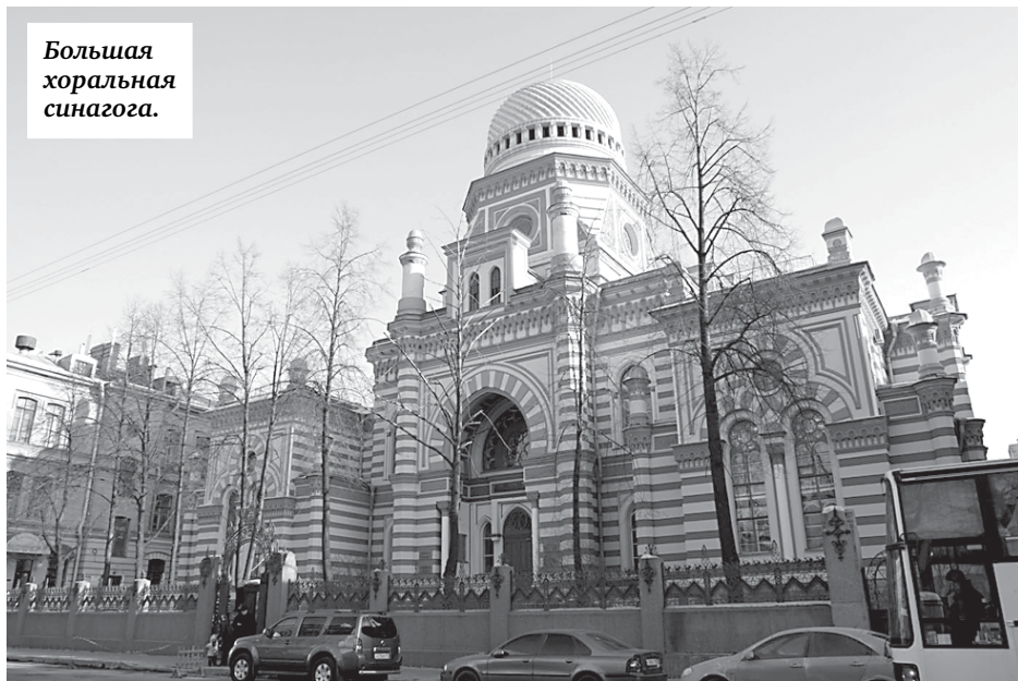
Большая хоральная синагога.

● В ближайшее время оденется в леса Большая хоральная синагога на Лермонтовском проспекте, 2.