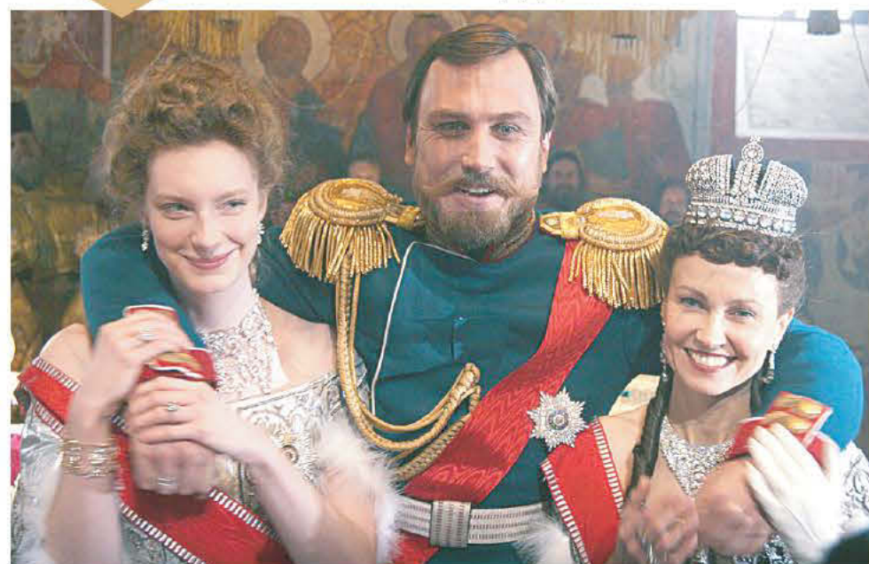
Императора (Ларс Айдингер), его супругу (Луиза Вольфрам) и вдовствующую императрицу (Ингеборга Дапкунайте) играют иностранные актеры. Но ведь и их герои, Романовы, были почти полностью немцами по крови.