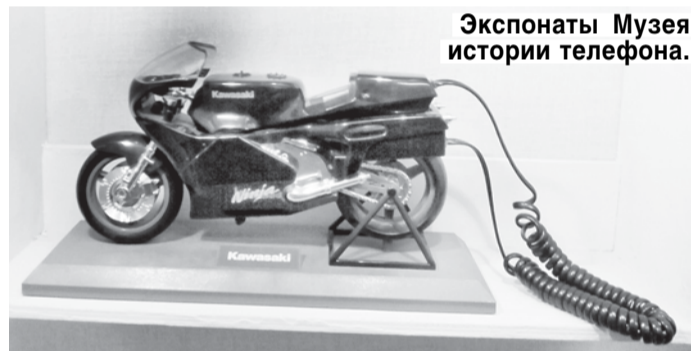
Экспонаты Музея истории телефона.

За основу коллекционеры берут машинки фабричного производства, но тщательно доводят каждую модель до состояния, максимально приближенного к реальности. В коллекции есть и всем известные автомобили, и — предмет особой гордости коллекционеров — автомобили, так и не дошедшие до стадии массового производства. Есть и образцы просто редких машин вроде открытого автобуса со съемным верхом, который возил пассажиров в солнечном Сочи: эти летние автобусы выпускал местный авторемонтный завод, и «в жизни» их практически не осталось.