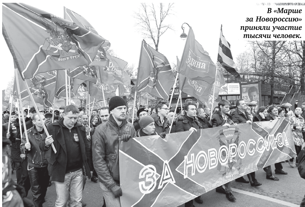
В «Марше за Новороссию» приняли участие тысячи человек.

По материалам информагентств подготовил Иннокентий ВНЕШНИЙ