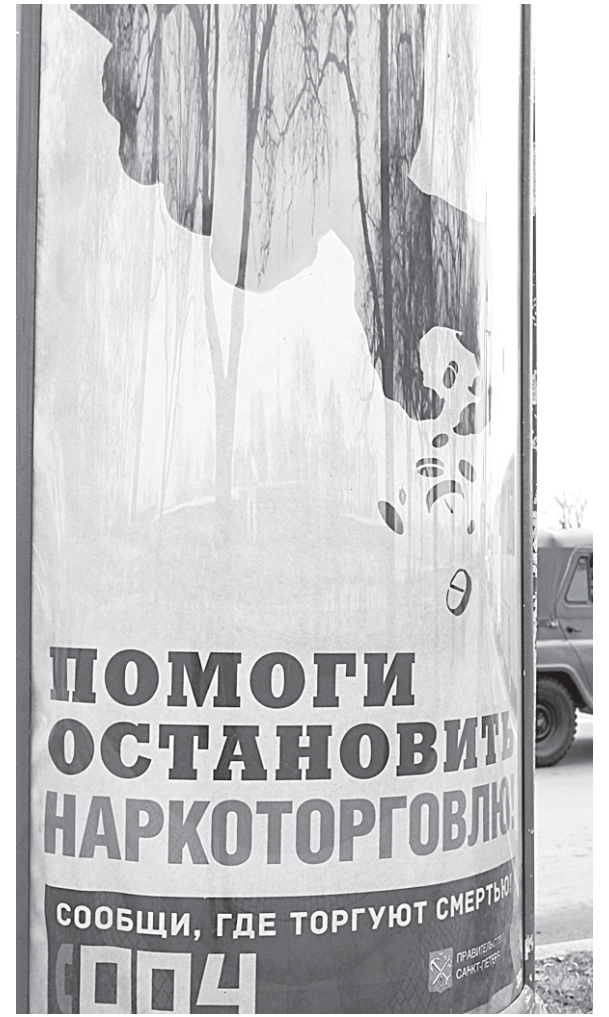
Борьба с наркоторговлей должна стать делом не только правоохранительных органов, но и всего общества.