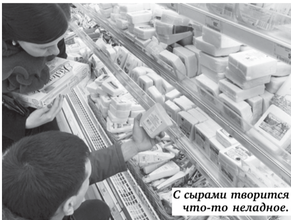
С сырами творится что-то неладное.

В СВЯЗИ С ПРАЗДНИКАМИ наш еженедельный мониторинг цен дал небольшой сбой, последний отчет о ценах был опубликован 27 октября, то есть две недели назад. За это время в супермаркете, в котором мы постоянно инспектируем цены, стоимость продуктов из нашего списка изменилась по двум позициям. Стоимость пакетированного молока с 49 руб. повысилась до 51 руб., пошехонского сыра по 339 руб. за килограмм, как и две недели назад, мы на витрине не обнаружили. Из традиционных марок относительно недорогих сыров в продаже наличествовал только голландский по 495 руб., а самым дешевым оказался сыр под малоизвестным брендом «Сыробогатов» — по 419 руб. В общем, с сырами творится что-то неладное. Во-первых, их выбор резко уменьшился, а во-вторых, известные марки становятся дефицитом. Чуть подешевело филе семги охлажденной, однако вид у него был не очень аппетитный. Очевидно, из-за высокой цены народ обходит этот продукт стороной и рыбака заливается на витрине.