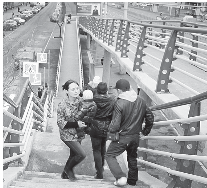
Пользоваться пешеходной конструкцией крайне неудобно.