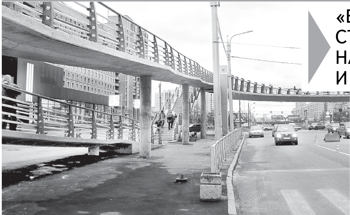
Переход поднят над землей на 5,5 метра и на ветру раскачивается.