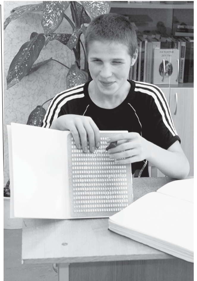
Так выглядит прибор для письма по Брайлю.

Чтение брайлевской литературы способствует развитию чувствительности пальцев и мелкой моторики. В русском языке слово «чтение» является однокоренным со словами «почтение», «почитание». Поэтому цель нашего издательства состоит в том, чтобы люди читали и почитали, ценили книгу.