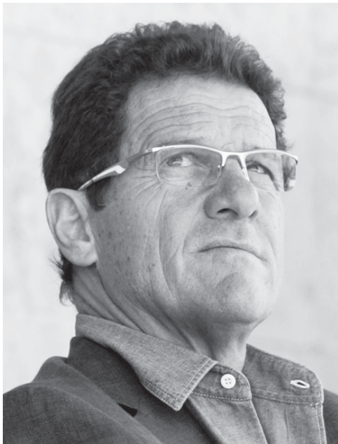
Фабио Капелло за весь российский футбол не отвечает...

— Проблема глубже. В клубах никто не работает над организацией игры в обороне. А это большая наука. Особенно это стало заметно с приходом в наш футбол иностранных тренеров. Вспомните, как говорил Дик Адвокат, тренировавший «Зенит»: я, мол, не буду выполнять работу, которую должны делать тренеры в детско-юношеских школах. Мы привыкли к другому. Раньше, если ты не улучшал игру в обороне, тебя не брали из дубля в основной состав. А иностранному тренеру остается только купить легионера,