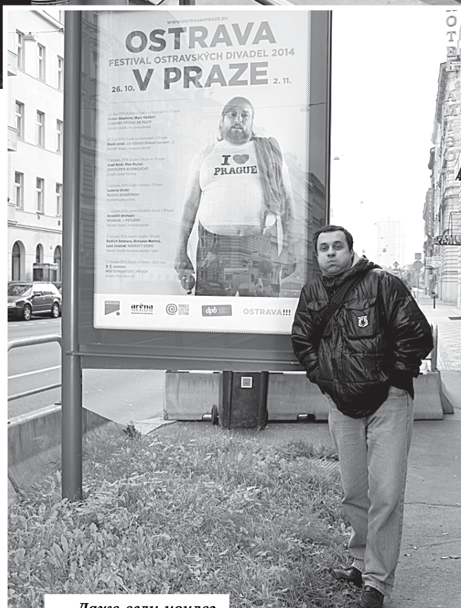
Даже если ночлег окажется не особо комфортным, ничто не мешает насладиться красотами Европы.

Для среднего класса, зарабатывающего немного, но стабильно, все еще актуальна связка сервиса поиска дешевых авиабилетов с сервисами электронного бронирования отелей. Только тогда вы будете уверены, что проведете отпуск спокойно, недорого и комфортно, а не только забываемо.