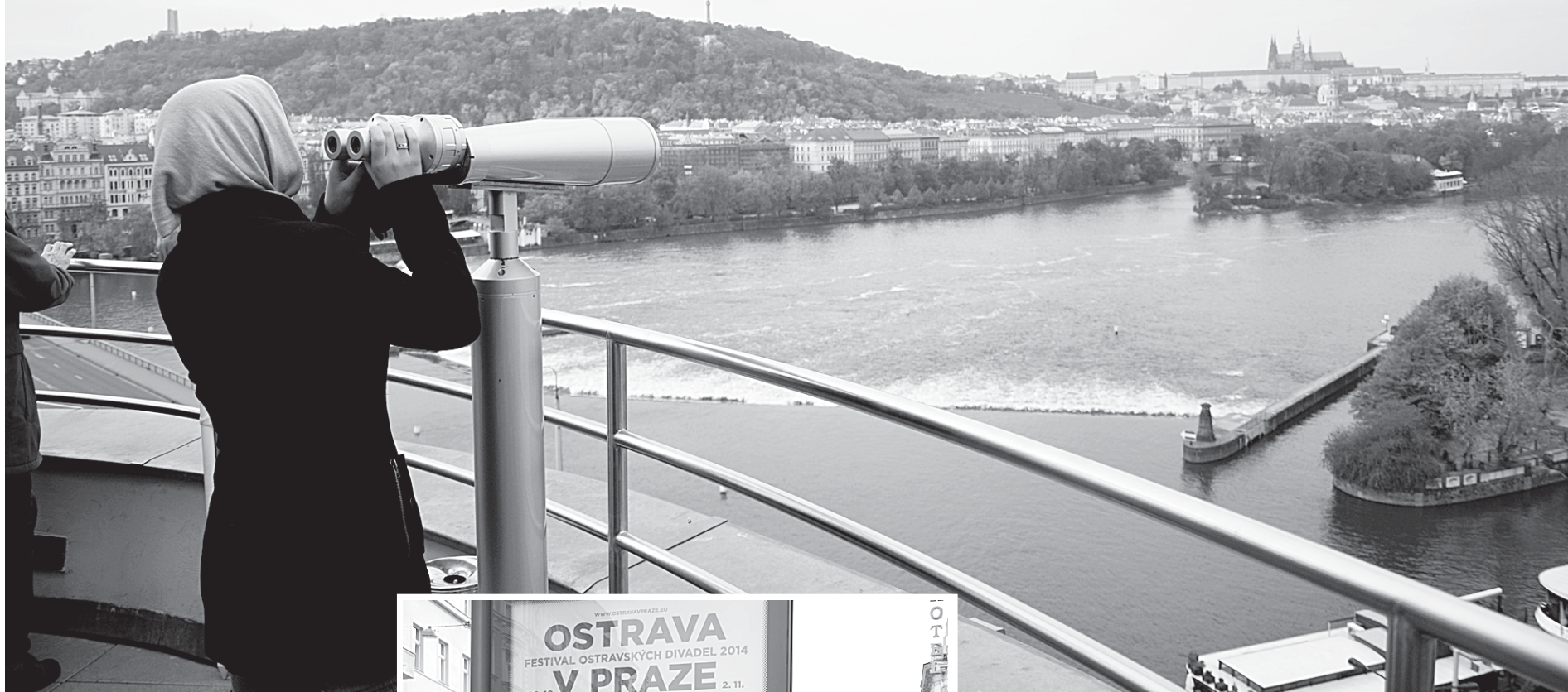
Увидеть Прагу, не переплачивая, — задача не из легких.

чужими людьми и приспосабливаться к темпу их жизни.