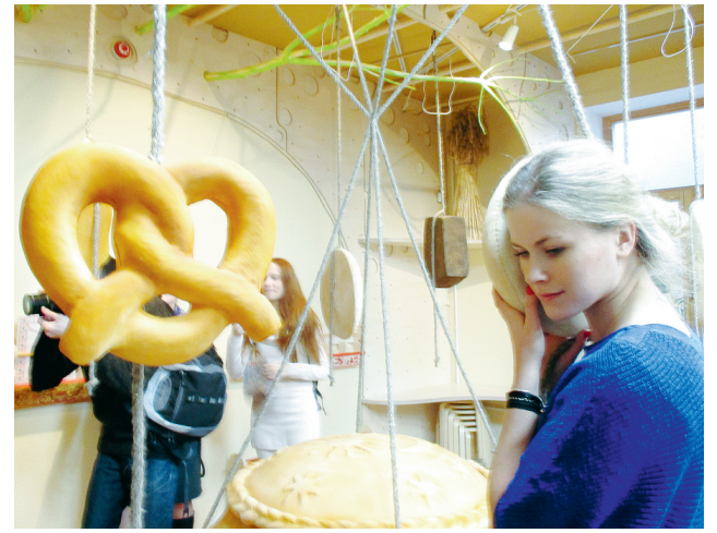
Каравай, батон, крендель рассказывают посетителям свои истории.