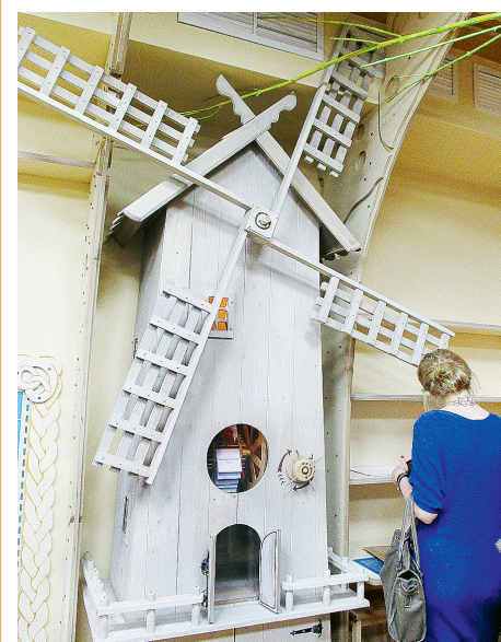
Мельница, с которой начинается сотворение хлеба нашего насущного.

Основная идея детского центра: хлеб живет и дышит, прорастает из зерна, поднимается тестом в квашне. Хлеб собирает память культуры и истории людей из разных уголков мира.