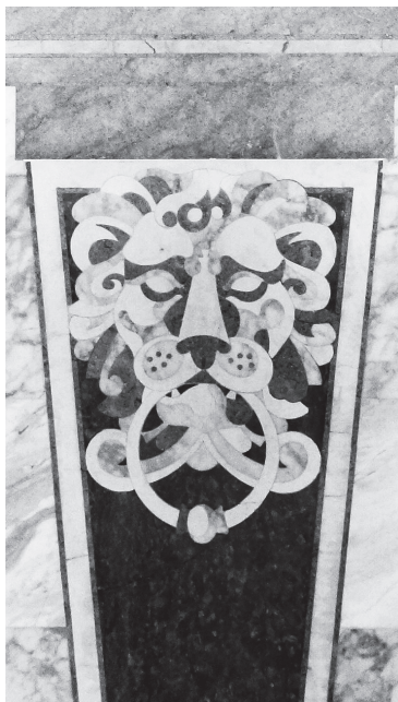
Маска льва — новое лицо «Лиговского проспекта».