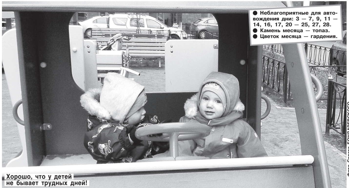
Хорошо, что у детей не бывает трудных дней!

ности, соединение Юпитера с Луной. Рекомендуется голодание. Лучше не есть убойную пищу и не напрягать зрение.