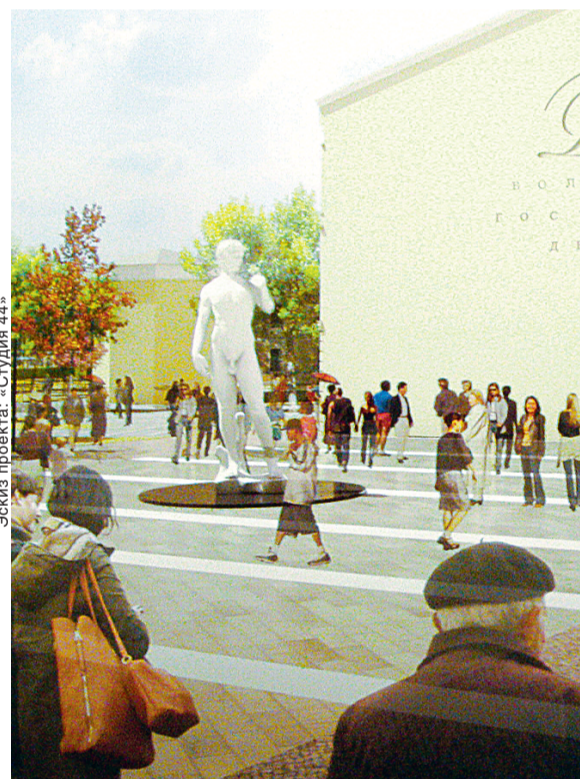
Эскиз проекта: «Студия 44»

НА ВНУТРЕННИХ ТЕРРИТОРИЯХ КОМПЛЕКСА ПРЕДЛАГАЮТ ВОССОЗДАТЬ ПАРК, РАЗБИТЬ ОГОРОД И УСТРОИТЬ ПРУД