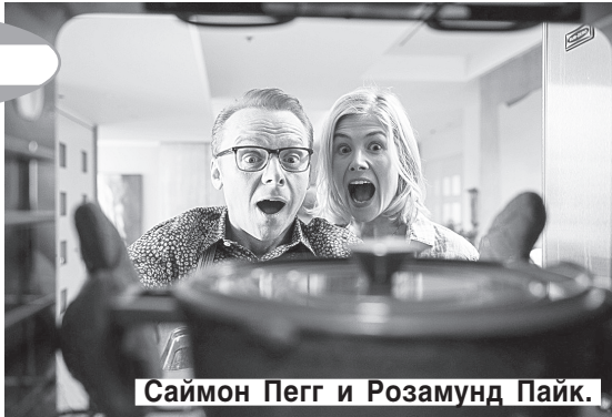
Саймон Пегг и Розамунд Пайк.