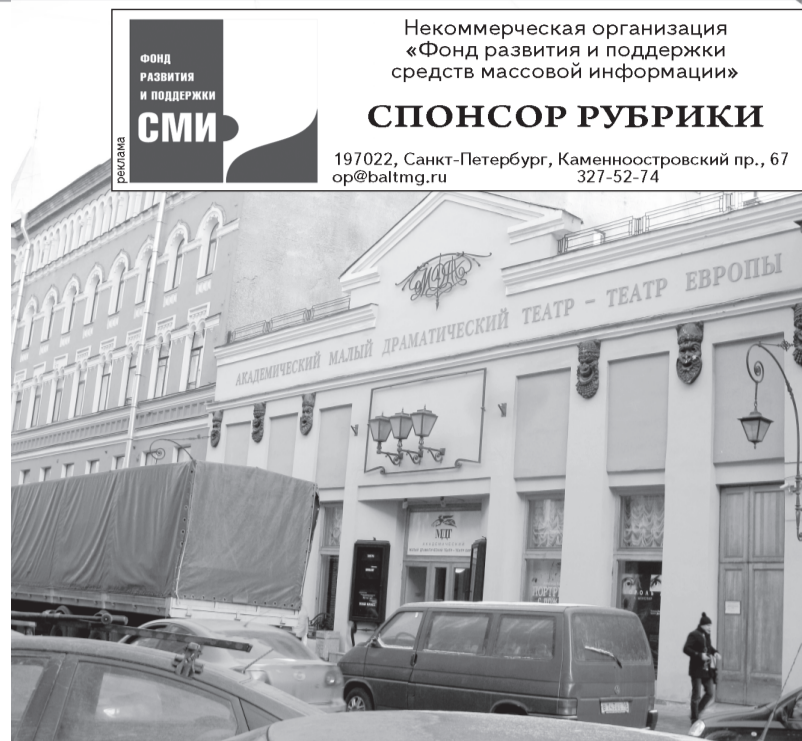
Вечная фура перед фасадом Театра Европы — одна из примет улицы Рубинштейна.