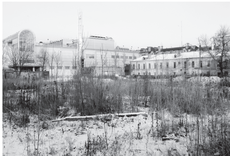
Строительство Новой сцены МДТ развернется на пустыре за океанариумом — на бывшем фуражном дворе Семеновского полка.