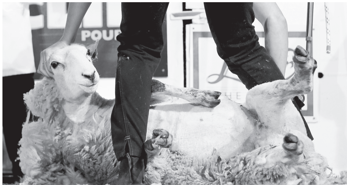
И стрижка овец может вызывать спортивный азарт.

Вот только перспективы включения стрижки овец даже в показа-