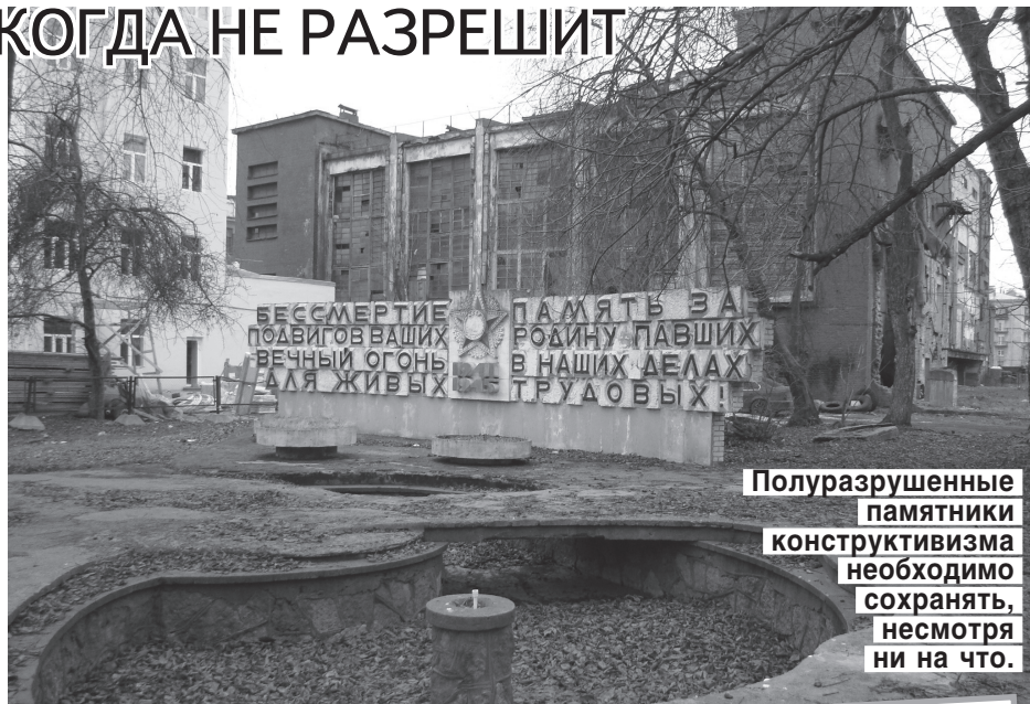
Полуразрушенные памятники конструктивизма необходимо сохранять, несмотря ни на что.