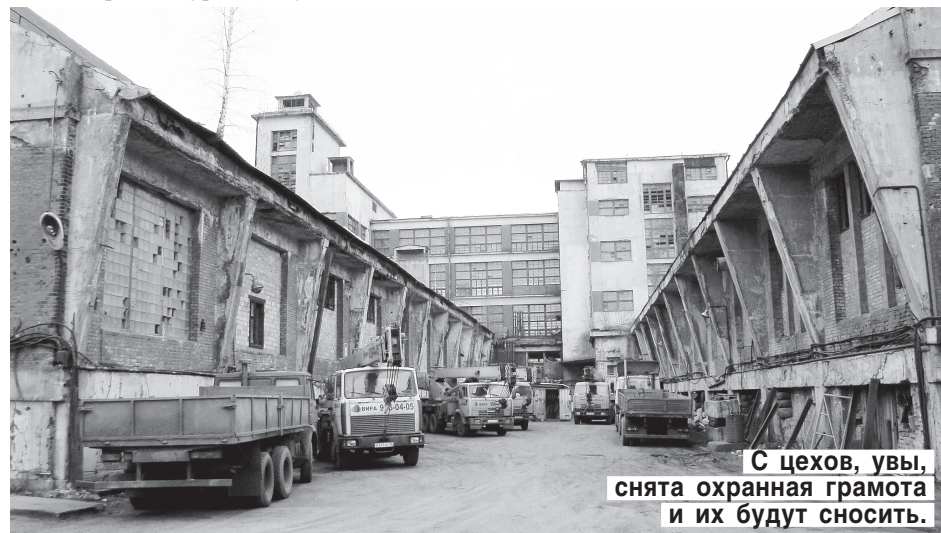
С цехов, увы, снята охранная грамота и их будут сносить.

— Мало. Но сколько успели. В начале двухтысячных даже выпустили альбом петербургской урбанистики. После чего наш отдел распустили.