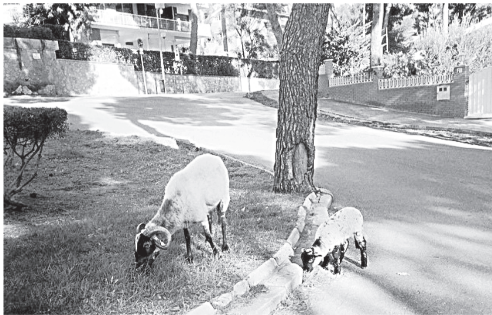
Кабанчиков-то и не видно — только овцы да бараны...

Павел ВЛАДИМИРЦЕВ