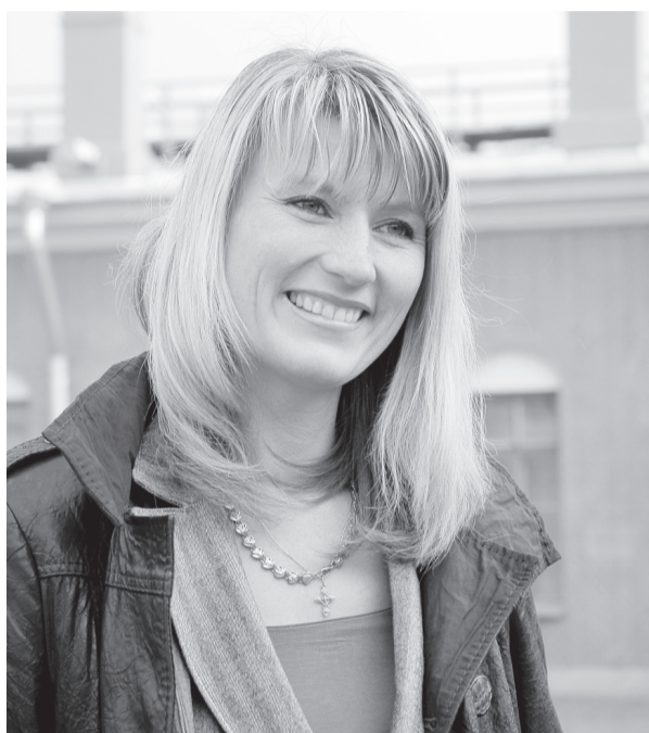
Светлана Журова верит в светлые перспективы гольфа как олимпийского спорта.

«Чувствую себя словно в деревне: кабачки, овцы, — поразила читателей аккаунта Кузнецова (@SvetlanaK27), выложив фотки с пасущимися у ее дома козлами. — Еще я побывала на футболе. Хотела написать про отношение в Испании к футболу. Мне один человек сказал, что можно поме-