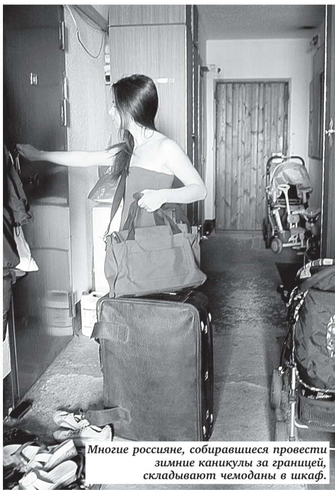
Многие россияне, собиравшиеся провести зимние каникулы за границей, складывают чемоданы в шкаф.