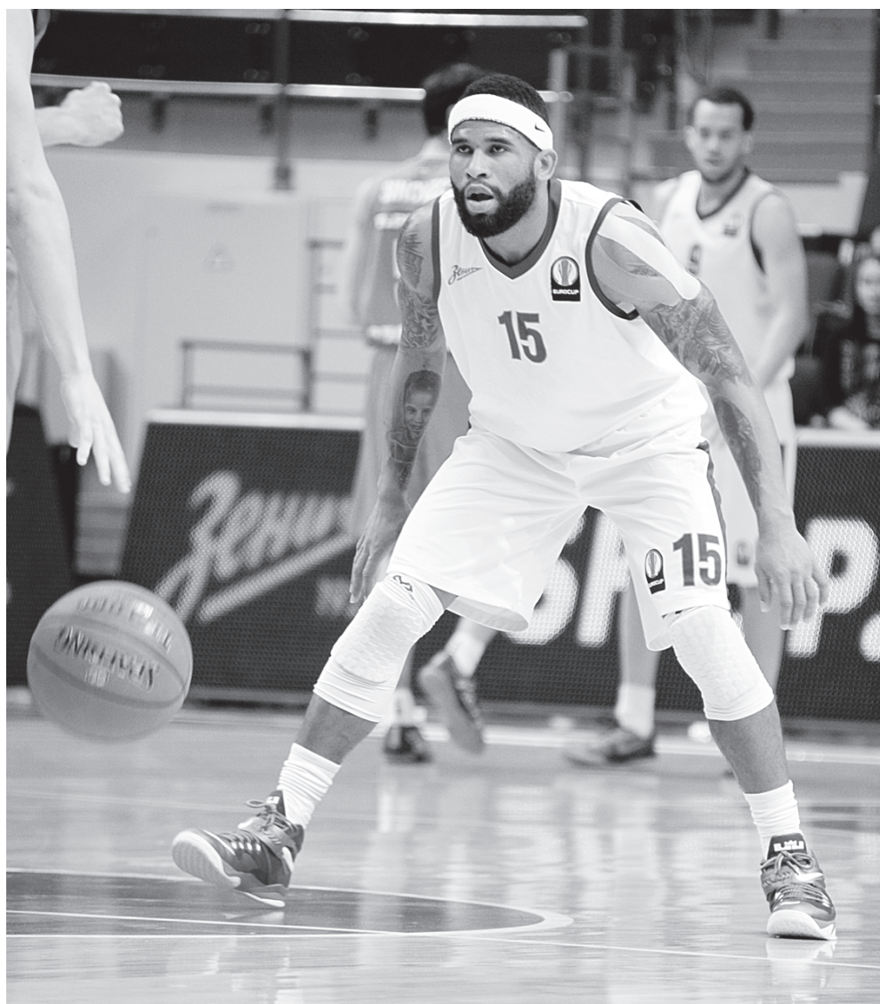
С мячом в руках разыгрывающий «Зенита» способен сотворить любое чудо.

ялась, что вот-вот грянет война или случится еще что-то страшное. Я же думал только о своей работе, потому что этим обеспечиваю будущее своей семьи. Если произойдет серьезное, вернусь домой. Но в России очень хороший чемпионат: здесь всегда стараются започтить отменных американских баскетболистов.