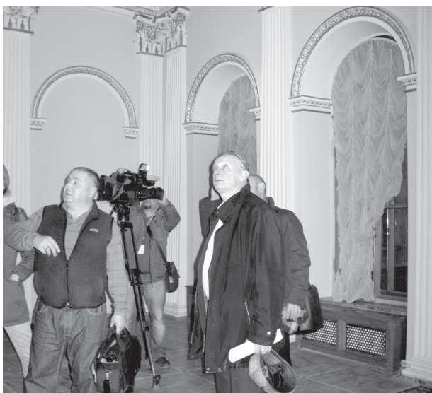
Журналисты города смогли проинспектировать, как идет реставрация особняка Сухозанета.