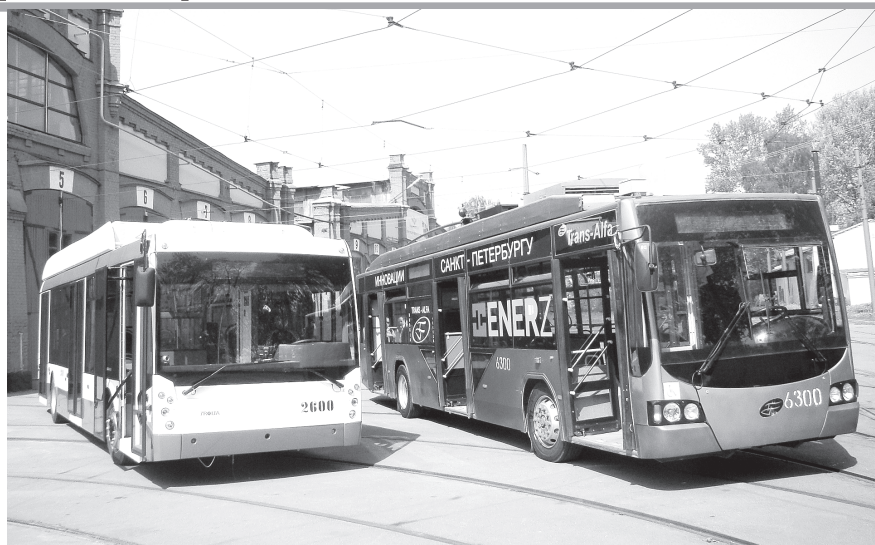
Новые троллейбусы могут какое-то время обходиться без контактной сети.

И снова о тарифах. Проезд в 2015 году подорожает и в трамвае, и в троллейбусе. Вместо 25 будет 28 рублей (рост — 12%).