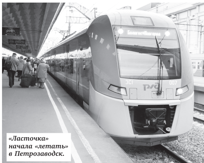
«Ласточка» начала «летать» в Петрозаводск.

Из других запоминающихся событий — появление секций для раздельного сбора мусора на 15 ж.-д. платформах, а также пуск «Ласточки» в Петрозаводск и пуск рельсового автобуса по маршруту Петербург — Выборг с заходом в Приморск. Отличие такого автобуса от обычного поезда: комфортные вагоны, мягкие кресла, кондиционеры. Цена на билет осталась прежней.