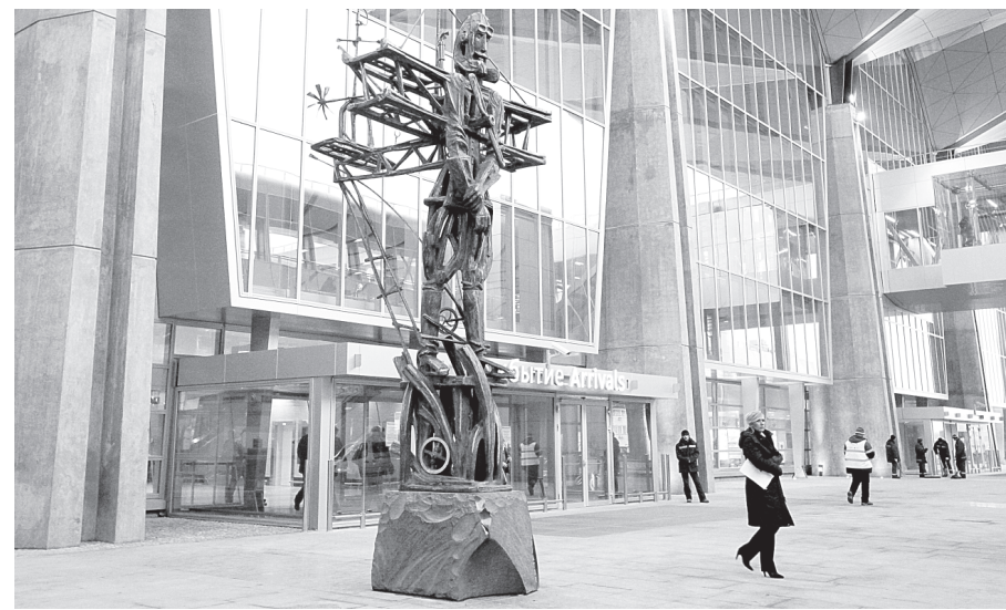
Пропускная способность нового терминала — до 17 млн. пассажиров в год.

Стоит отметить появление на остановках табло с бегущей строкой, на которых в режиме реального времени выводится информация о типе прибывающего транспортного средства (автобус, трамвай, троллейбус) и его номере. Такие информационные модули установлены в Адмиралтейском, Василеостровском и Центральном районах — всего 101. В будущем они должны появиться на всей городской сети. Другая приятная новость: стоимость билета в муниципальном автобусе в наступающем году останется прежней — 25 рублей. Впрочем, стоит вспомнить и повышение в уходящем году стоимости проезда в маршрутке — до 36 рублей.