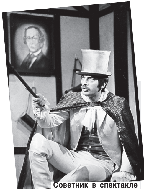
Советник в спектакле «Снежная королева». 1978.

— На вопрос о новогодней же традиции вы многие годы отвечали, что свя-