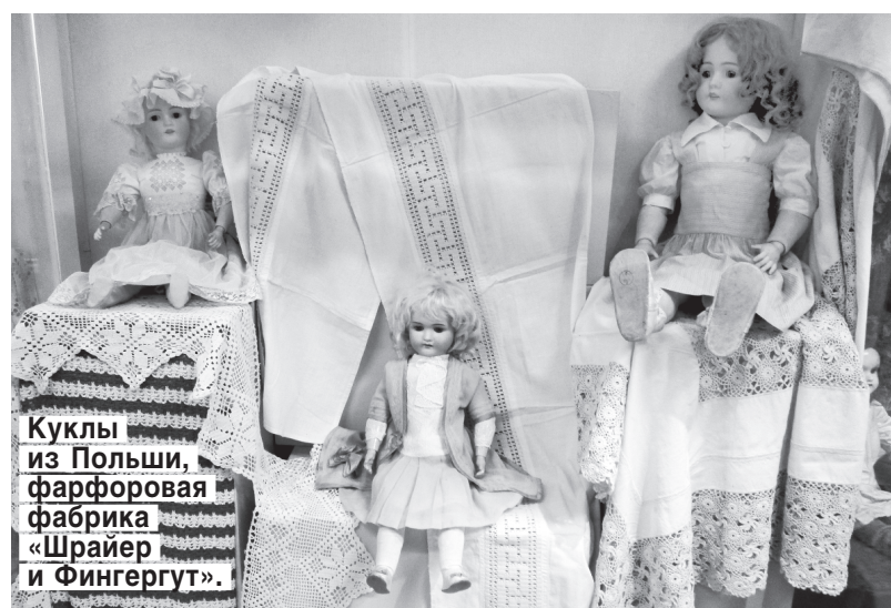
Куклы из Польши, фарфоровая фабрика «Шрайер и Фингергут».