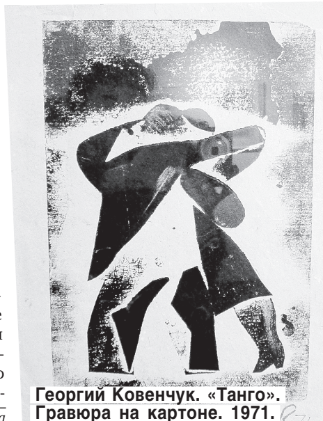
Георгий Ковенчук. «Танго». Гравюра на картоне. 1971.