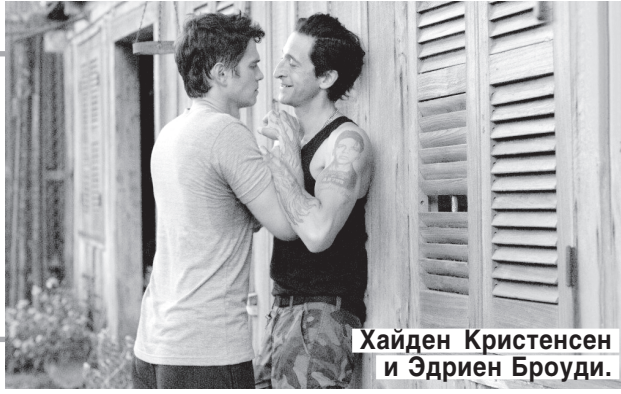
Хайден Кристенсен и Эдриен Броуди.