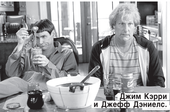
Джим Кэрри и Джефф Дэниелс.