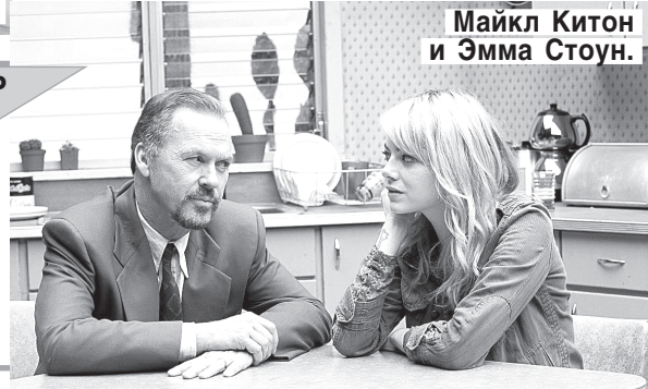
Майкл Китон и Эмма Стоун.

ДРАМА. Бывший актер решает принять участие в новой бродвейской постановке с целью вернуть себе былую славу, блеск и величие.