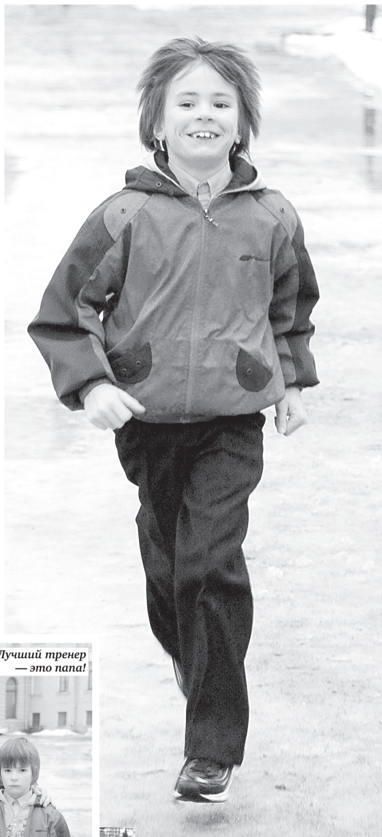
Лучший тренер — это папа!

И в спортивном плане кандидат в мастера, который серьезно занимался бегом во время учебы в Военмехе (до мастерского норматива ему не хватило буквально сотых секунды!), пока еще много может дать своему сыну. Хотя Бебик-старший и не пренебрегает