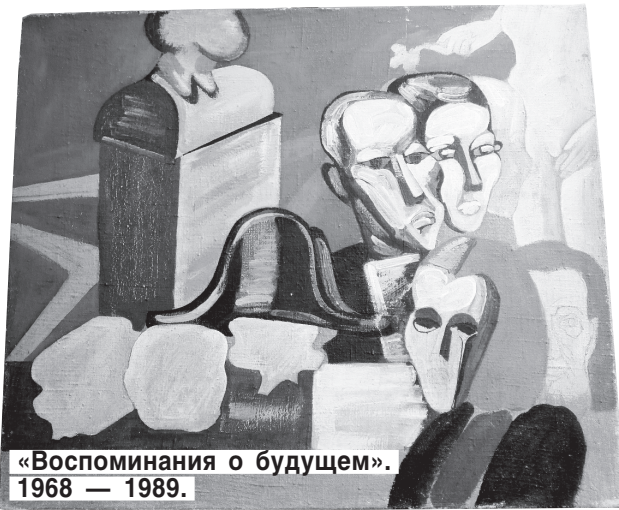
«Воспоминания о будущем». 1968 — 1989.