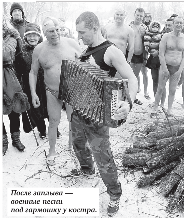
После заплыва — военные песни под гармошку у костра.