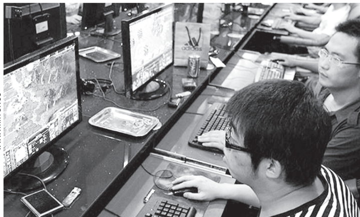
Интернет-клуб в Тайбэе, где произошла трагедия.

Смерть констатировали от внезапной остановки сердца. Оказалось, что игроман провел в клубе трое суток подряд без перерыва! Аналогичный случай произошел несколькими днями раньше в другом компьютерном клубе Тайбэя, где 38-летний мужчина также умер после непрерывной игры — однако уже в течение пяти (!) суток подряд.