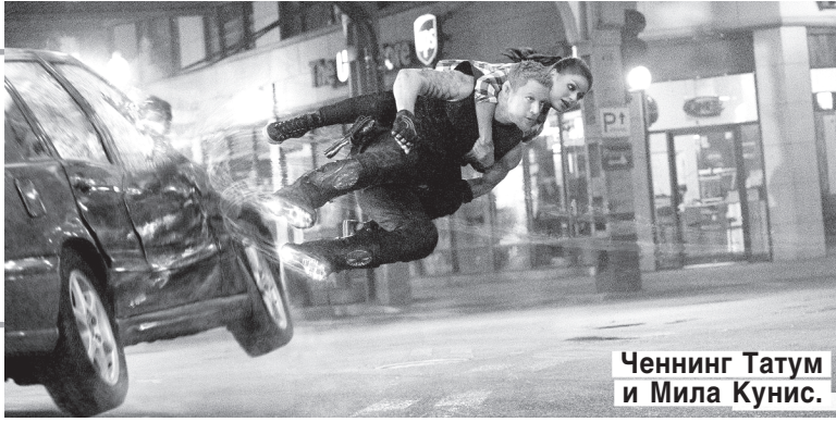
Ченнинг Татум и Мила Кунис.