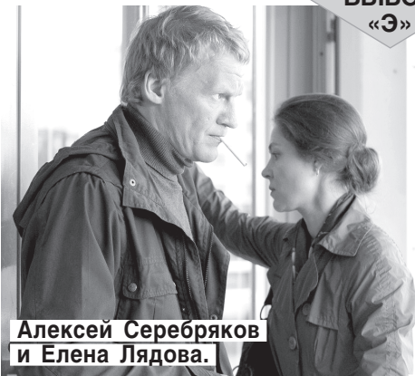
Алексей Серебряков и Елена Лядова.

Призы на фестивалях в Канне, Абу-Даби, Польше, Сербии, «Золотой глобус», номинация на «Оскар».