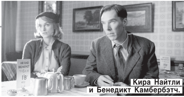
Кира Найтли и Бенедикт Камбербэтч.

БИОГРАФИЧЕСКИЙ ФИЛЬМ о выдающемся английском математике Алане Тюринге, который помог взломать код Enigma во время Второй мировой войны. Тюринг также вошел в историю как одна из самых знаменитых жертв гомофобии.