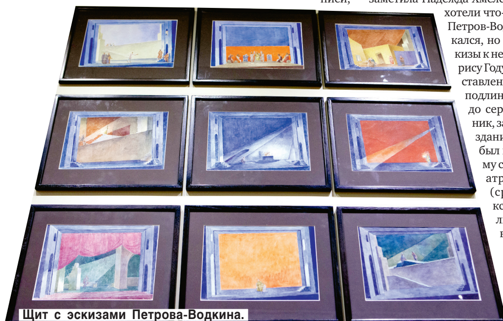
Щит с эскизами Петрова-Водкина.