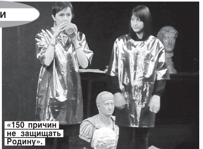
«150 причин не защищать Родину».

На только что открывшейся сцене «Эрарты» кроме пока-