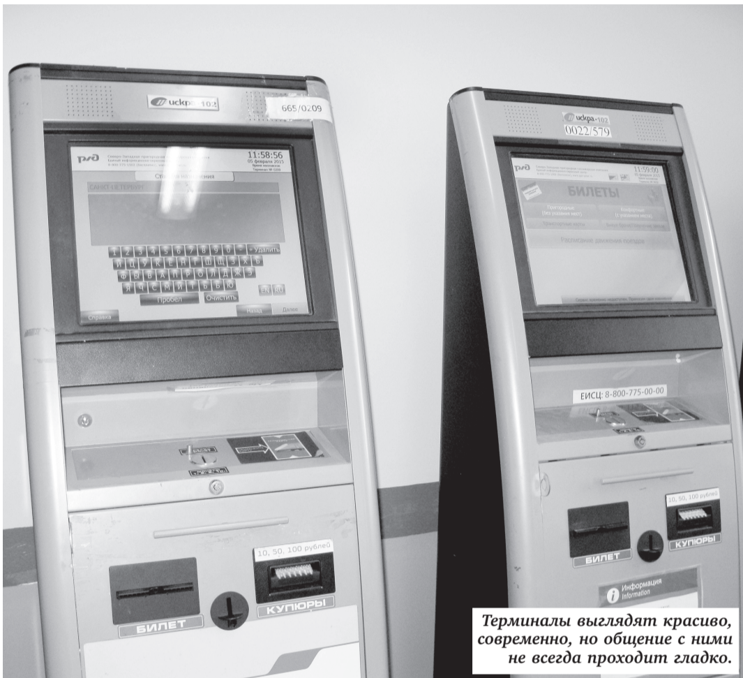
Терминалы выглядят красиво, современно, но общение с ними не всегда проходит гладко.

«Среднее время на оформление билета через терминал самообслуживания 15 — 25 секунд при оплате наличными», — гарантирует СЗППК. Конечно, если автомат работает и пассажир быстро разберется со станциями назначения. Но, например, наши читатели из пригородных районов пожаловались редакции: нет в автоматах такой станции — Санкт-Петербург.