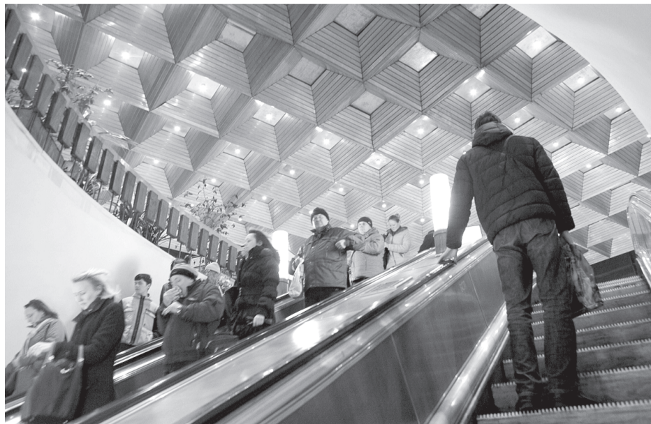
На обновленных эскалаторах балюстраду «переоденут» в нержавеющую сталь.

нюю часть станции, но и наземный вестибюль.