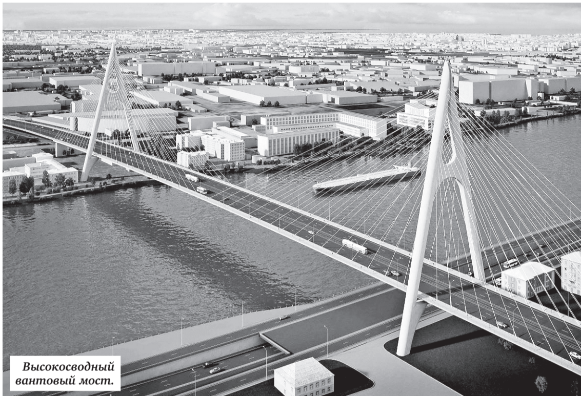
Высоководный вантовый мост.

Эскиз проекта: пресс-служба вице-губернатора Марата Оганесяна.