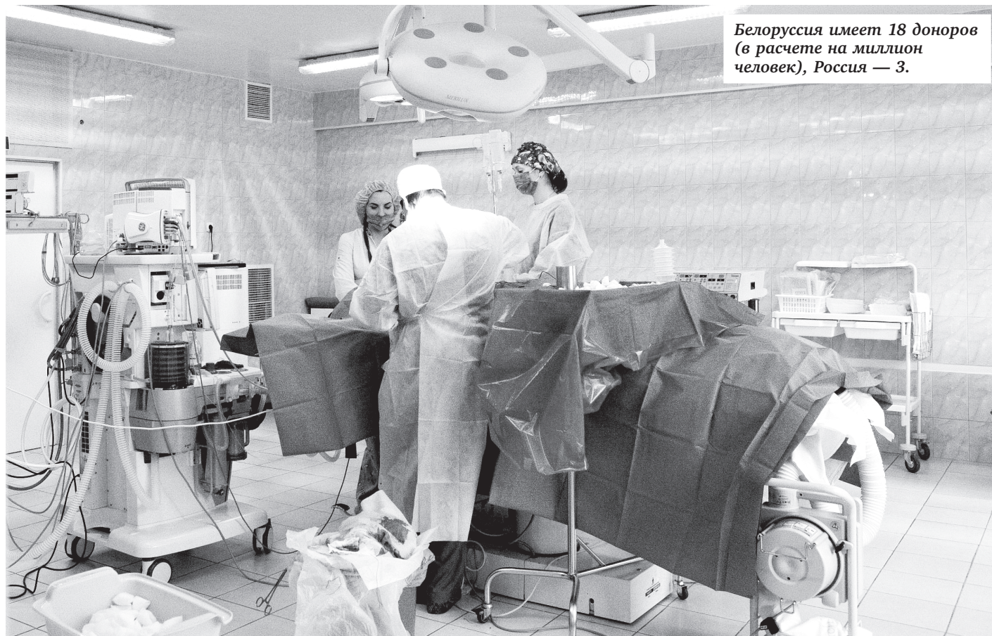
Белоруссия имеет 18 доноров (в расчете на миллион человек), Россия — 3.

нать, кто подарил им орган, а значит, шансы на новую, полноценную жизнь? Знакомись ли они с семьями ушедших людей?