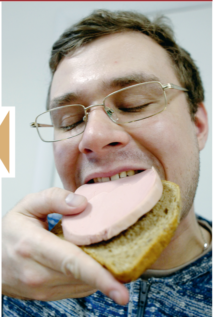
Наш ответ Чемберлену!