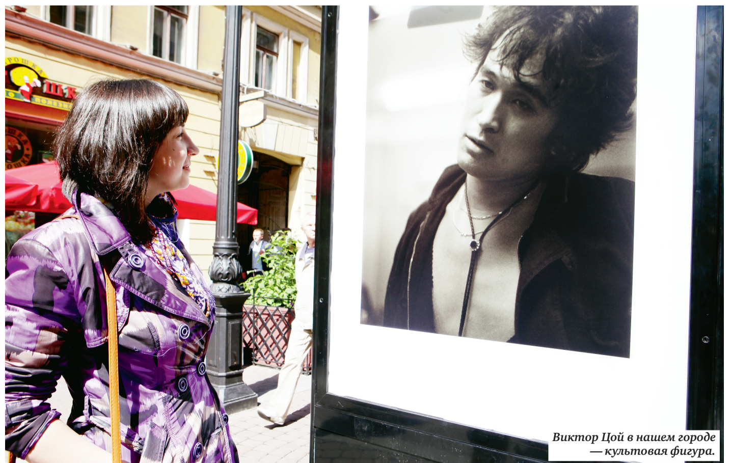
Виктор Цой в нашем городе — культовая фигура.