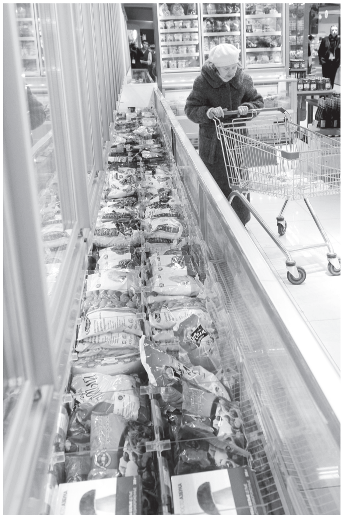
Работники торговых сетей должны вести себя с покупателями более корректно.

Законопроект, за который проголосовали 45 депутатов, был рассмотрен в первом чтении, второе состоится через две недели. Потом депутаты внесут его на рассмотрение коллег из Госдумы.